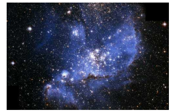
Kleine Magellansche Wolke (KMW)

Die Entfernungsbestimmung „naher“ Galaxien gelang erstmals 1923 dem Astronom Edwin Hubble mit Hilfe von Cepheiden. Die Astronomin Henrietta Leavitt hatte 1912 an 25 so genannten \delta -Cepheiden (speziellen Pulsationsveränderlichen) in der Kleinen Magellanwolke (KMW) erkannt, dass deren Pulsationsperiode p fest mit der scheinbaren Helligkeit verknüpft ist. Da alle Sterne der KMW etwa gleich weit entfernt sind, hängt die absolute Helligkeit und damit die Leuchtkraft dieser \delta -Cepheiden nur von der Pulsationsdauer p ab.